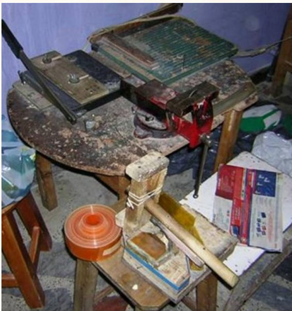
Imagem real de uma fábrica de medicamentos ilegal