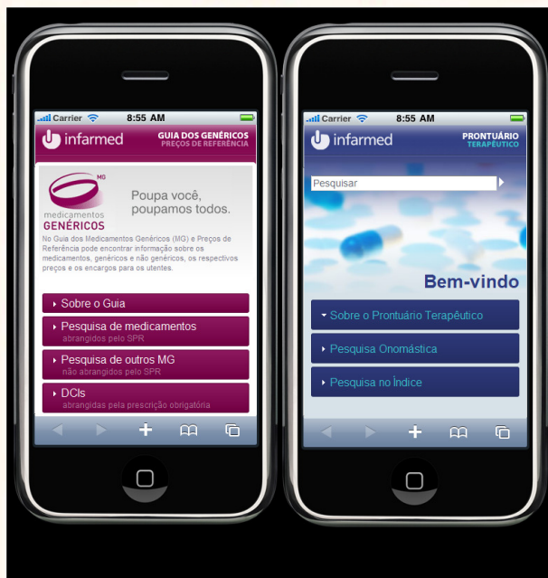
Páginas de entrada do site móvel do Guia dos Genéricos e do Prontuário Terapêutico