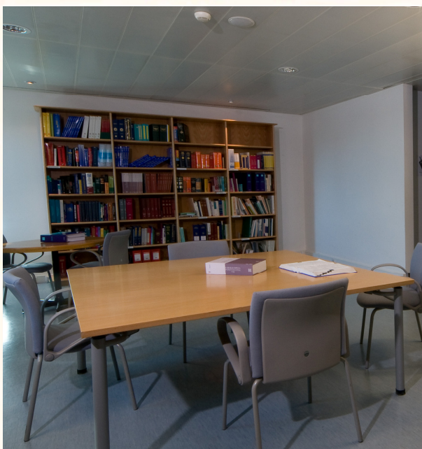
Sala do CDTC